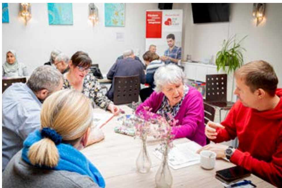
Der Offene Treff: Nicht bloß Kaffee trinken, sondern vor allem ins Gespräch kommen und miteinander lernen.